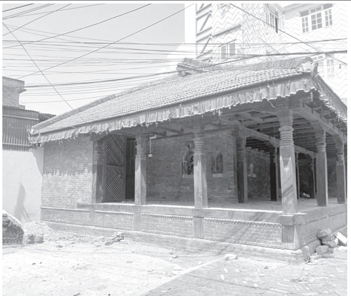
पुनर्निर्माणपछि काठमाडौं महानगरपालिकाले पुनर्निर्माण गरेको इन्द्रसभा । काठमाडौं महानगरपालिका-१९ मा पर्ने यो सभास्थल इन्द्रजात्रा पर्वसँग सम्बन्धित धार्मिक, सांस्कृतिक, ऐतिहासिक एवं सामाजिक महत्त्वको ठाउँ हो ।