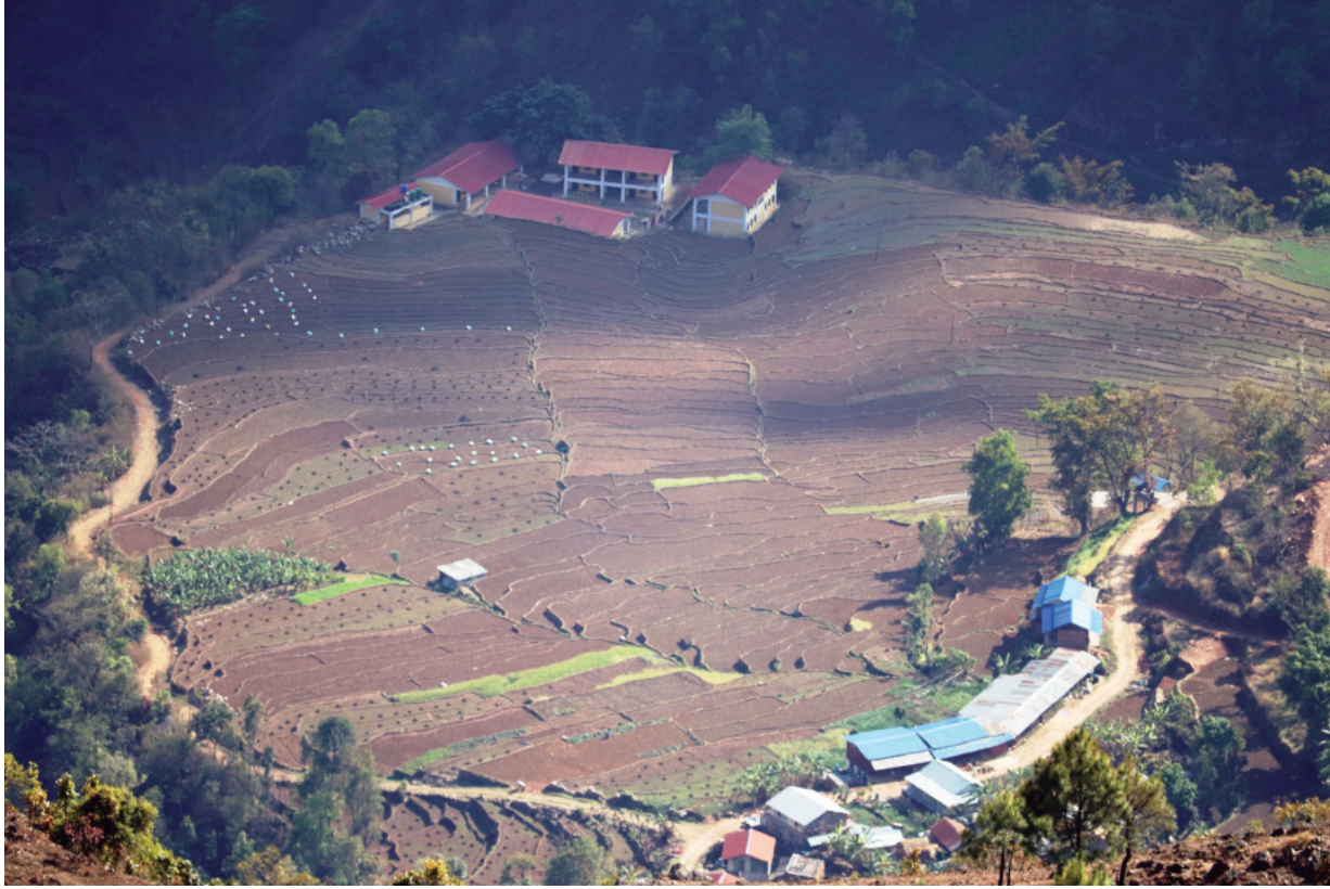
तारकेश्वरको नुवाकोटको तारकेश्वर गाँउपालिका-६ स्थित भमरा फाँट । यस फाँटलाई कृषि उज्जनीको भण्डारण स्थलको रूपमा लिइन्छ भने उर्वराभूमि जोगाउन सडक, विद्यालय र मानववस्ती फाँट छेउछाउमा विस्तार गरिएको छ ।