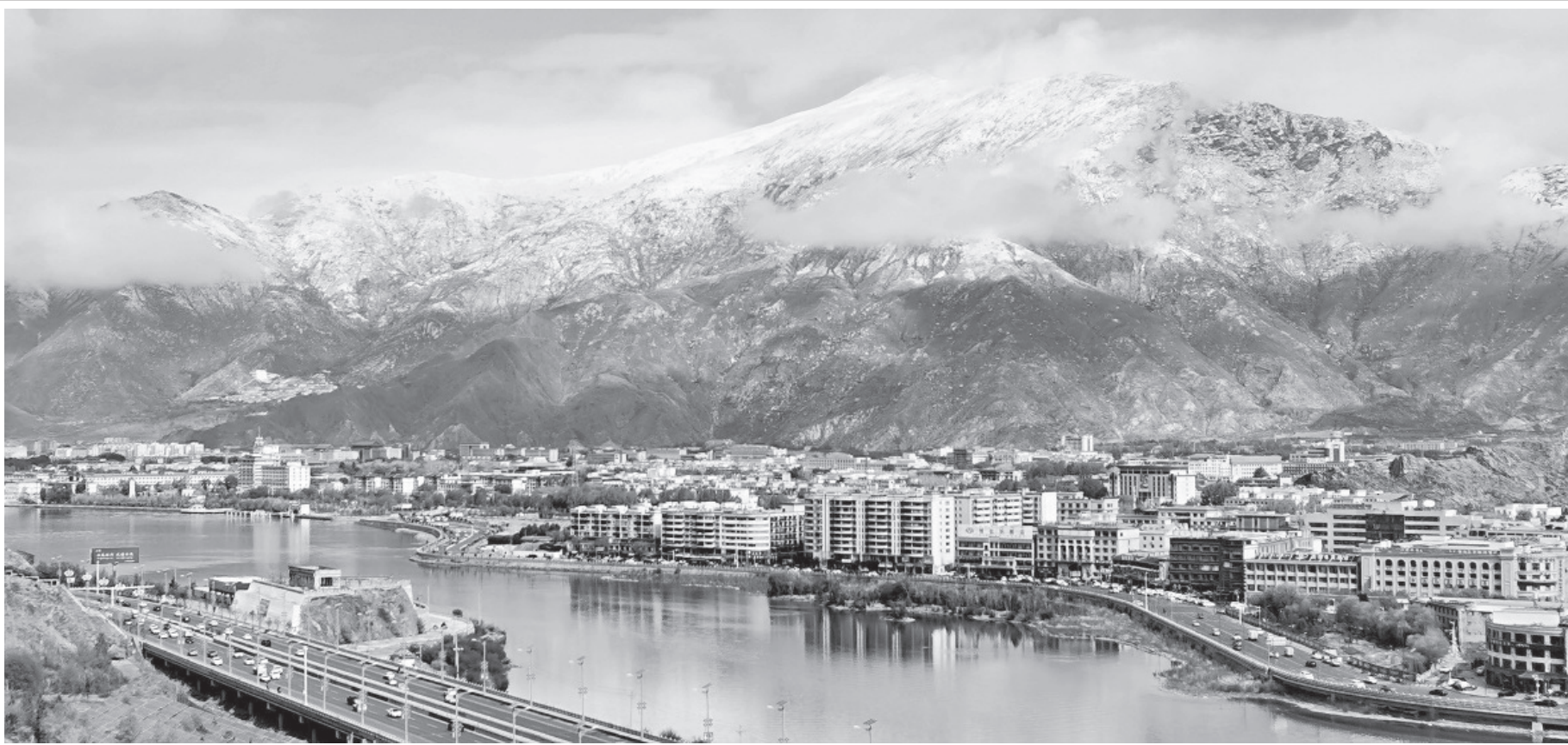
ल्हासाको दृश्य | दक्षिणपश्चिम चीनको तिब्बत स्वायत्त क्षेत्रको राजधानी ल्हासाको नानसान पार्कबाट देखिएको सहरको दृश्य।