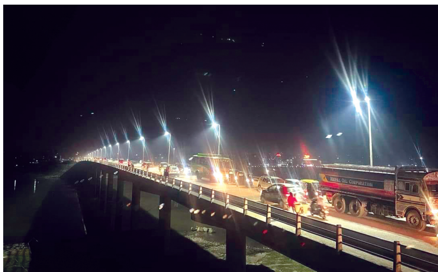
नारायणी पुल किलोमिटर गत जेठमा हावाहुरीले सम्पूर्ण विद्युत् पोल ढालेपछि अन्धकार बनेको छ। भरतपुर महानगरपालिका र नेपाल विद्युत् प्राधिकरणको राष्ट्रिय सडक बत्ती प्रवर्द्धन आयोजनाले पुलमा पोल राखेर स्मार्ट बत्ती जडान गरेसँगै पुल क्षेत्र किलोमिटर बनेको हो।