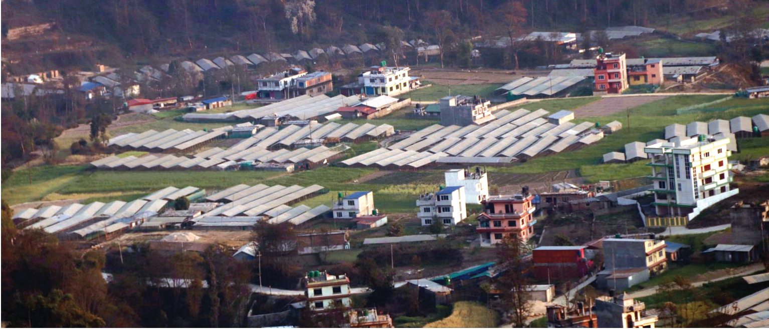
तरकारी खेतीका लागि टनेल काठमाडौंको तारकेश्वर नगरपालिका-१, साङलास्थित खेतमा व्यावसायिकरूपमा मौसमी तथा बेमौसमी तरकारी खेती गर्न किसानले निर्माण गरेको टनेल।

वर्ष ९ अंक ३१० काठमाडौं शनिबार, २७ फागुन २०७९ Prabhav National Daily Saturday, March 11, 2023 www.prabhavonline.com पृष्ठ ८ मूल्य रु. ५१-