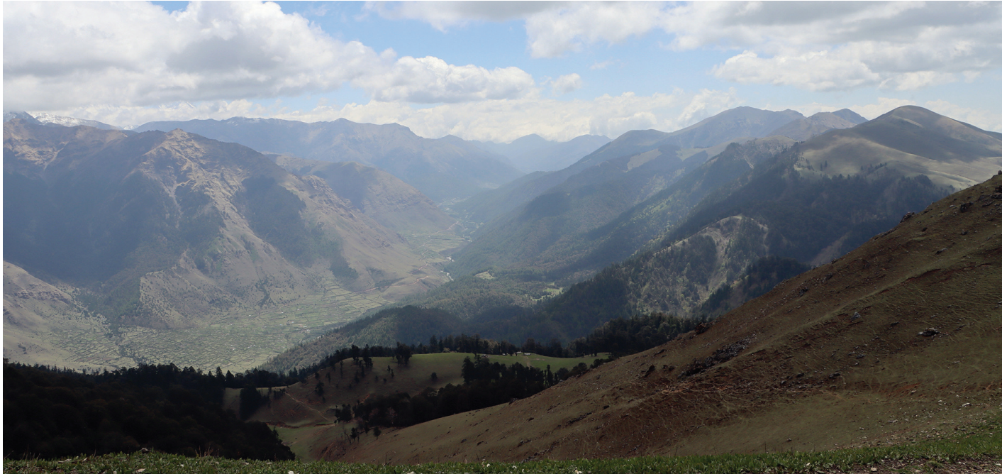
चौरीलेकबाट देखिएको रूकुम (पूर्व)को भूमे गाउँपालिका वडा नम्बर १ स्थित पर्यटकीय गन्तव्य चौरी लेकबाट देखिएको ढोरपाटन क्षेत्र ।