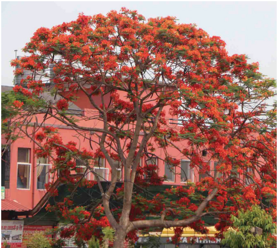
फूलो गुलमोहर भरतपुरस्थित केन्द्रीय बस टर्मिनलभित्र फुलेको गुलमोहरको फूल। गर्मी महिनामा फुल्ने गुलमोहरलाई छहारीसँगै सौन्दर्य बढाउने फूलको रूपमा बगैँचा, सडक साइड तथा पार्कमा लगाइन्छ।