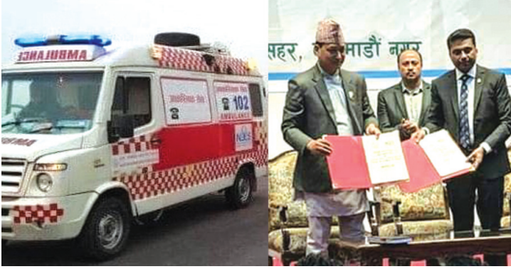
काठमाडौं महानगरपालिकाले सञ्चालन गरेको निःशुल्क एम्बुलेन्स (बायाँ) र २०७६ वैशाखमा यो सेवा सञ्चालनका लागि सम्झौतापत्रि महानगरका तत्कालीन प्रमुख शाक्य ।