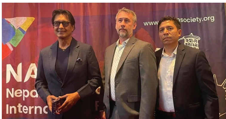
थपे 'तपाईंको दैनिकी वा जीवनलाई कुनै न कुनै हिसाबबाट सम्बोधन गर्छ, उत्प्रेरणा दिन्छ। त्यसैले यस्तो कलालाई नेपाली डायस्योराले साथ र सहयोग गर्नुपर्छ।' आइतबारसम्म चल्ने महोत्सवमा फिचर फिल्म, वृत्तचित्र, छोटा चलचित्र, एनिमेशन

काठमाडौं (प्रस)- नेपाल-अमेरिका अन्तर्राष्ट्रिय चलचित्र महोत्सवको छैटौँ संस्करण अमेरिकामा सुरु भएको छ। विहीबार वासिङ्टन डिसी मेरिल्याण्डस्थित एएफआई सिल्भर थियटरमा नेपाली चलचित्र 'एना भयालको पुतली' प्रदर्शनसँगै महोत्सव सुरु गरिएको हो।