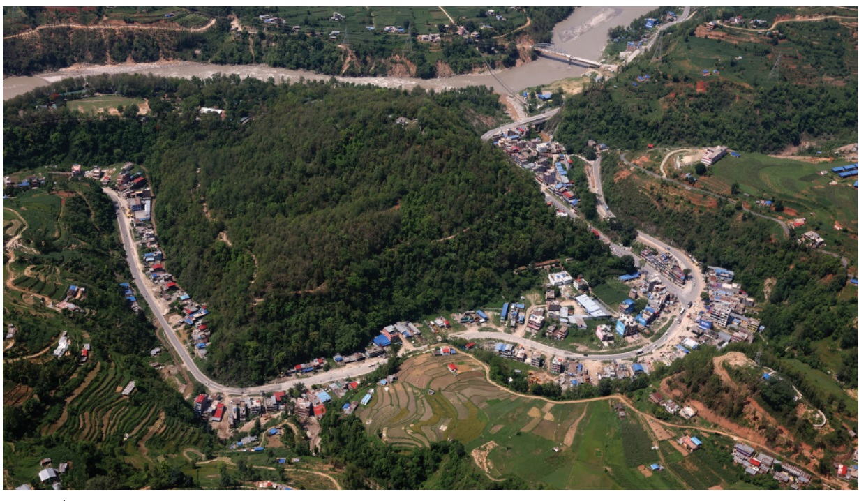
सुन्दर गल्छी आकाशवाट सोमबार लिएको धादिङ गल्छीस्थित पृथ्वीराजमार्ग आसपासको क्षेत्र।