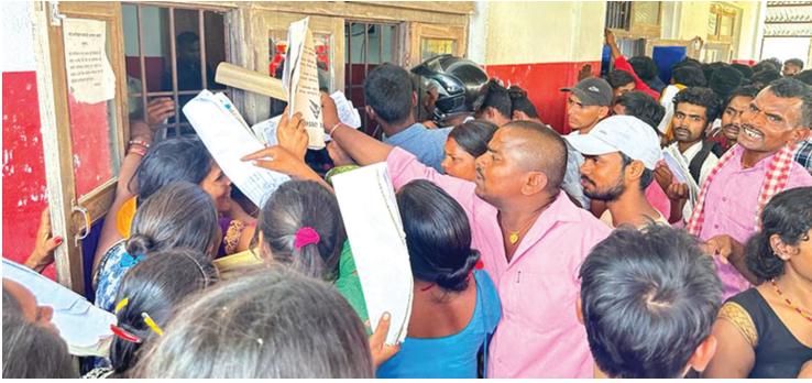
नागरिकता विधेयक प्रमाणीकरण भई कार्यान्वयनमा आएसँगै सोमबार जिल्ला प्रशासन कार्यालय सर्लाहीमा जन्मको आधारमा नागरिकता लिनेको भीड।