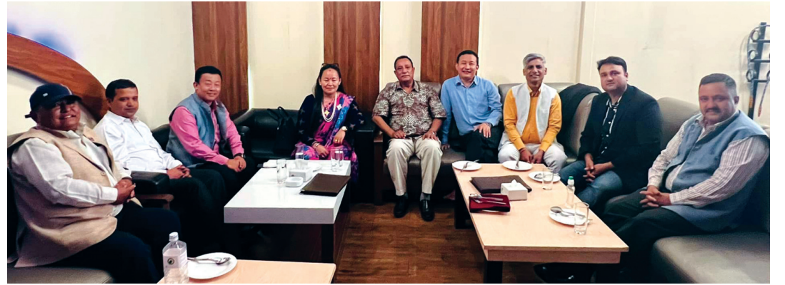
विश्वासको मतबारे रणनीति तय गर्न बिहीबार काठमाडौंमा बसेको गठबन्धनको बैठक।