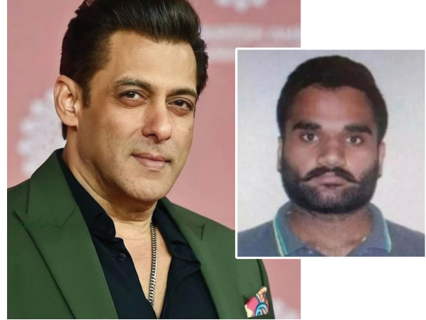
उनले दावी गरेका हुन्। मारेर विश्नोई समाजको वेइज्जत 'सलमानले काला हिरण गरेका छन्। विश्नोई समाज