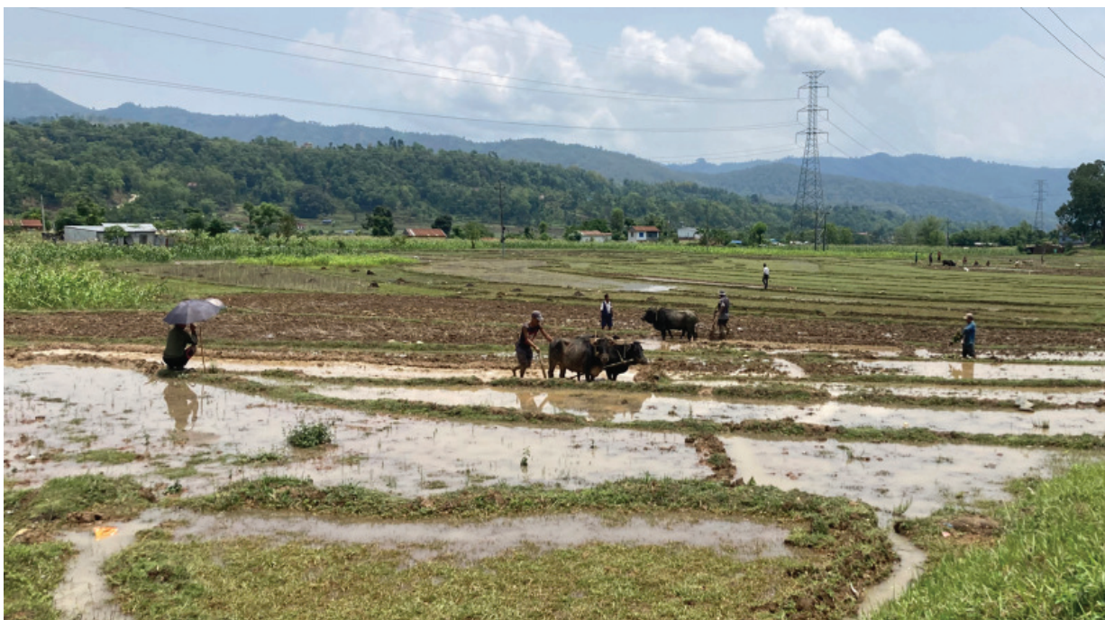
धानको बीउ राख्दै धान रोप्ने किसान। लामो समय खडेरी परेपछि धान रोप्ने बेलामा किसानले धानको बीउ राख्दै छन्।