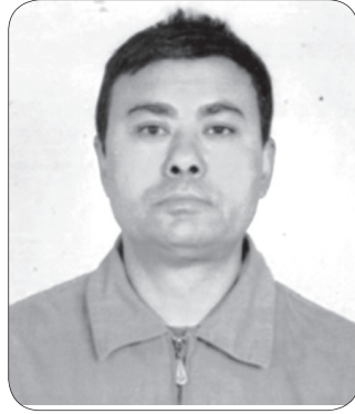
► पदम श्रेष्ठ

मुसाहरू किन पासोमा पर्थन् ? एउटा उत्तिको जवाफ छ कि मुसाहरूलाई सितैमा खान पाउँदैन भन्ने नै थाहा हुँदैन । त्यसैले उनीहरू सजिलै पासोमा पर्थन् । नेपाली नेताहरूको हालत यस्तै छ । सत्तामा पुग्नेबित्तिकै लवालस्कर लिएर अनुदानका लागि अनुनय गर्दै विदेश भ्रमणमा पुग्छन् । कसले बढी नयाँ परियोजनाको परिकल्पना गर्नेभन्दा पनि कसले बढी अनुदान ल्याउने प्रतिस्पर्धा नै हुन्छ नेताहरूमा । अनि विदेशी शक्तिको पासोमा पर्थन् । यसपटक भारत भ्रमणपछिको दाहालको छटपटीलाई पनि यसरी लिने कि ! यस्तो घटनाबाट अरु नेताले पनि सिक्ने कि !