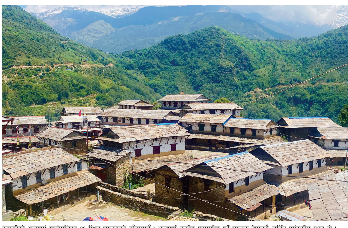
कास्कीको अन्नपूर्ण गाउँपालिका-११ स्थित घान्द्रुकको डाँडागाउँ। अन्नपूर्ण चक्रीय पदमार्गमा पर्ने घान्द्रुक नेपालकै चर्चित पर्यटकीय स्थल हो।