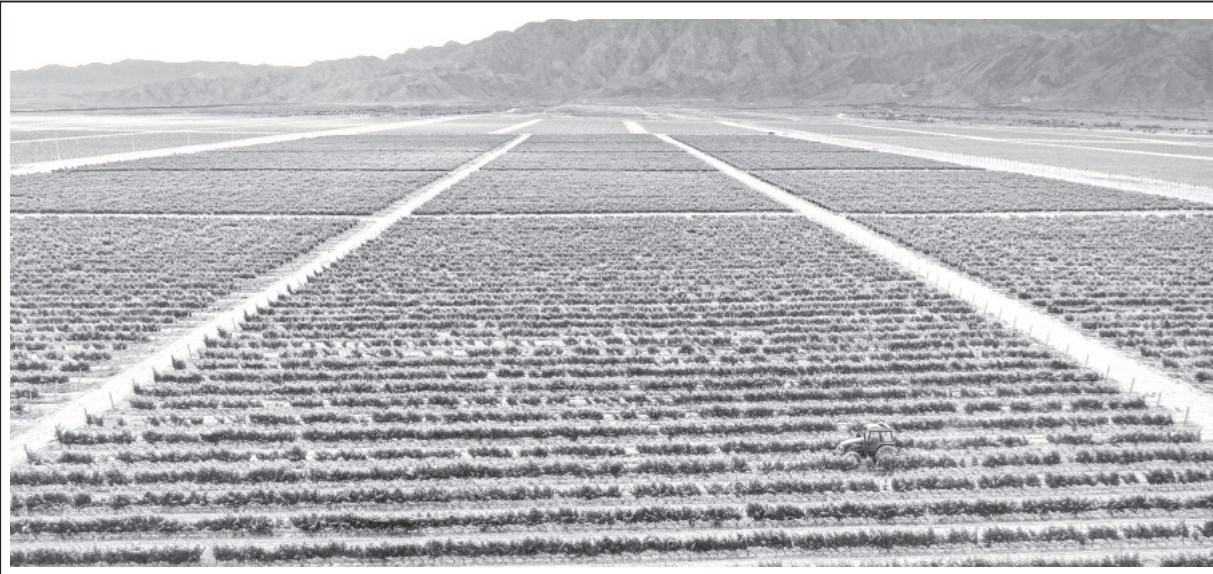
व्यावसायिक खेती | उत्तरपश्चिमी चीनको तिंजिया हुई स्वायत्त क्षेत्रको हेलान पर्वतको फेदमा लगाइएको वाइन ग्राप अर्थात् अंगुरको विस्वा।