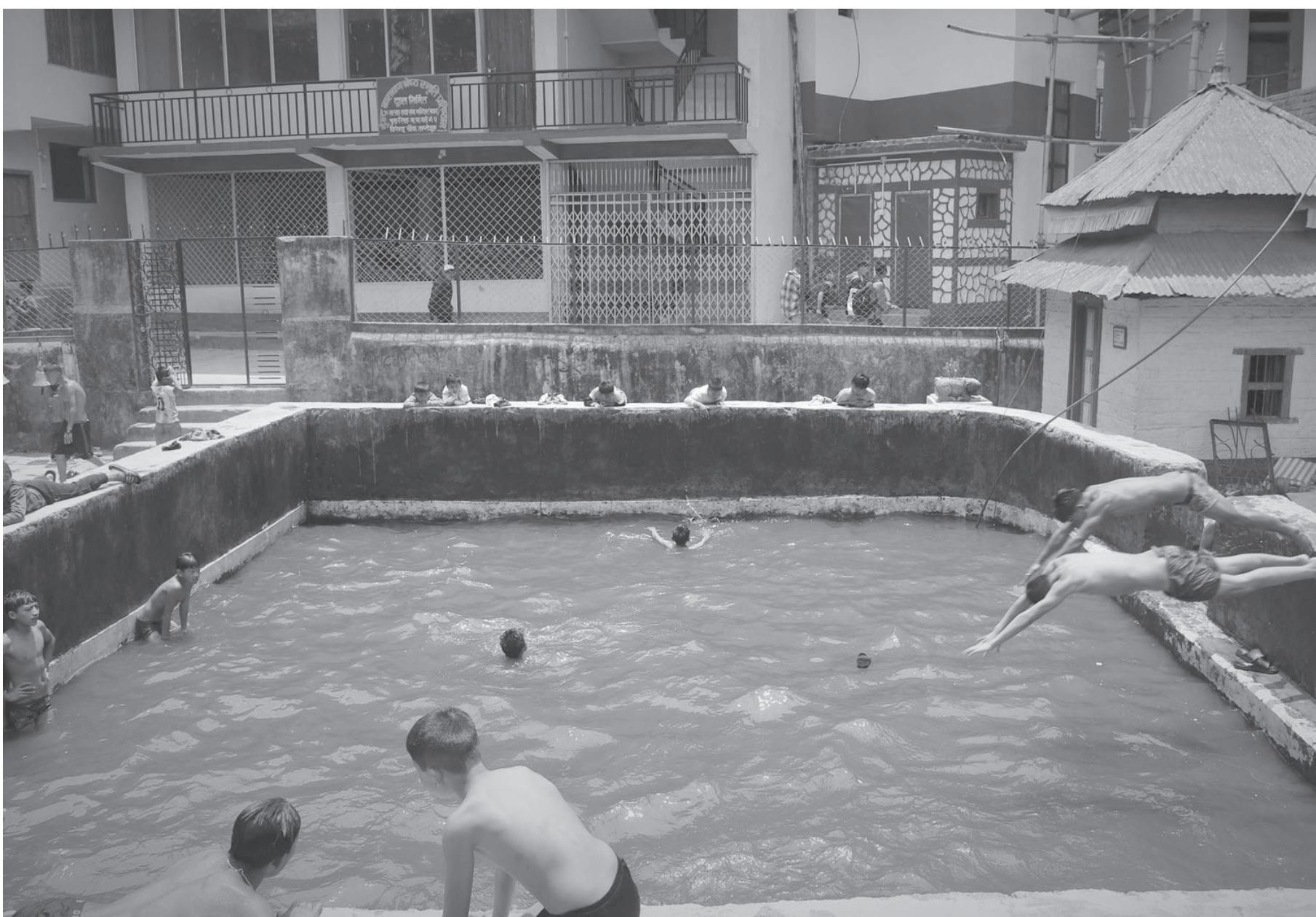
पौडीमा रमाउँदै बालबालिका हिमाली जिल्ला ताप्लेजुङको सदरमुकामस्थित वीरेन्द्रचोकमा रहेको पोखरीमा पौडी खेल्दै बालबालिका। चर्को घाम र अत्यधिक गर्मीका कारण बालबालिकाहरू पौडी खेल्न पोखरीमा जम्मा हुने गरेका छन्।