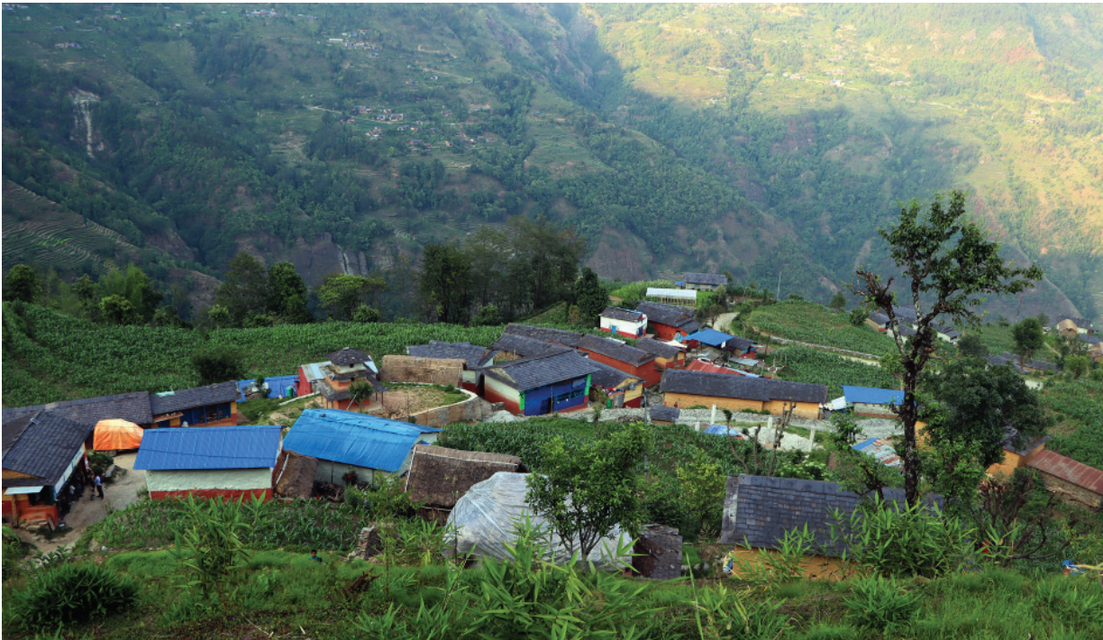
बागलुङको काठेखोला गाउँपालिका-३ स्थित धन्जागाउँ । पछिल्लो समय बसाइँसराई गरेर बजार क्षेत्रमा जान थालेपछि गाउँ सुनसान बन्दै गएको छ ।